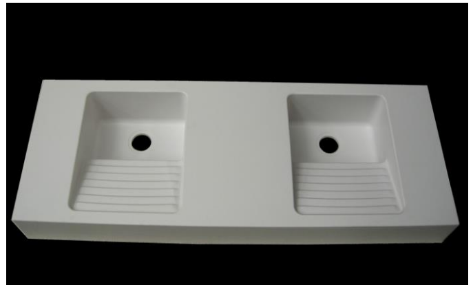
Version Surian Blanc S250

Cuve linge rectangulaire 400 x 500/240 x 220 mm avec une évacuation de \varnothing 90mm. Le dossieret arrière, la cuve, l'égouttoir, le plan de profondeur 650 mm et le bandeau frontal sont moulés monobloc sans joint.