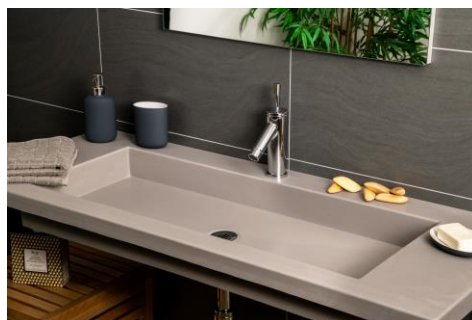
Version Surian Platine S7036, sans trop plein

Le dossier arrière, la vasque, le plan de profondeur 450 ou 500 mm et le bandeau frontal sont moulés monobloc sans joint. Ce modèle répond à la norme pour les Personnes à Mobilité Réduite.