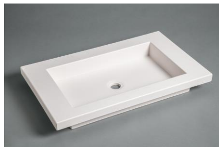
Version Surian Blanc S250, sans trop plein

Le dossier arrière, la vasque, le plan de profondeur 450 ou 500 mm et le bandeau frontal sont moulés monobloc sans joint. Ce modèle répond à la norme pour les Personnes à Mobilité Réduite.