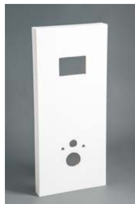
Version Surian Blanc S250

Habillage pour bâti support adapté à toutes les marques du marché. Plaque pré-percée en fonction du bâti support utilisé, ép.18 mm environ. Fabrication sur-mesure.