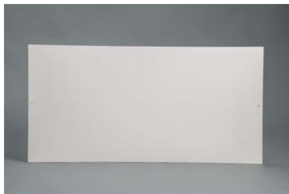
Version Surian Blanc S250, percé pour fixation

Tablier de baignoire épaisseur 15 mm Longueur 1300 < 2000, hauteur 400 < 600 mm. Fabrication sur-mesure.