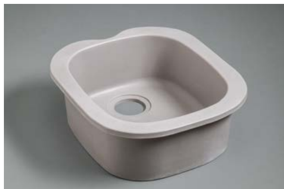
Version Surian Platine S7036