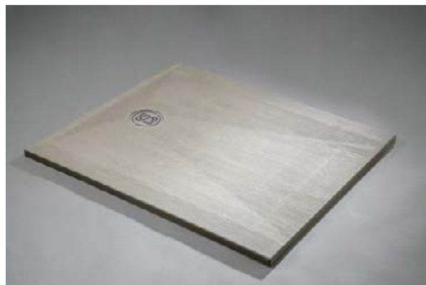
Version Surian Beige S1019