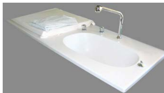
Version Surian Blanc S250, avec table à langer

En raison des mesures d'asepsie, il est déconseillé d'installer un système de trop-plein en milieu hospitalier.