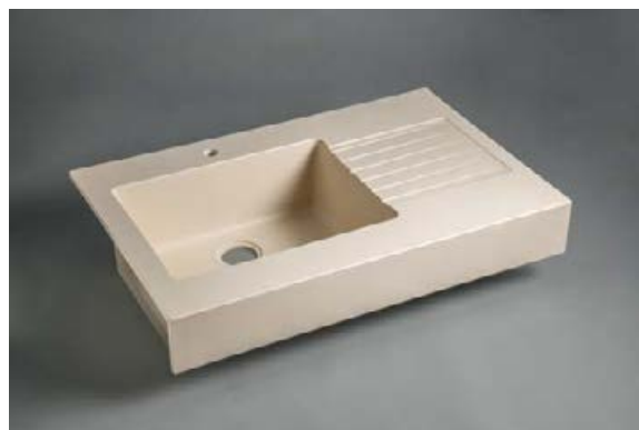
Version Surian Beige S1019

Le plan, les options cuve(s)/égouttoir(s) et le bandeau frontal de 40 mm sont moulés monobloc sans joint.