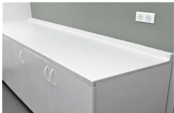
Version posé sur meubles

Le dossier arrière de 50 mm, le plan d'épaisseur 18mm et le bandeau frontal de 40 mm sont moulés monobloc sans joint.