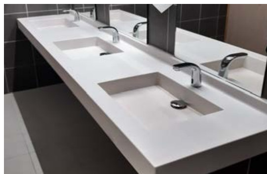
Version Surian Blanc S250, sans trop-plein

Ce modèle répond à la norme pour les Personnes à Mobilité Réduite.