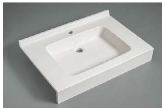
Version simple vasque Surian Blanc S250

Ce modèle répond à la norme pour les Personnes à Mobilité Réduite.