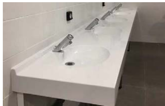
Version Marbol Blanc, avec joue latérale à gauche

(*selon modèle sur-longueur ou sur-mesure)