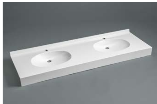
Version Marbol Blanc

Ce modèle répond à la norme pour les Personnes à Mobilité Réduite.