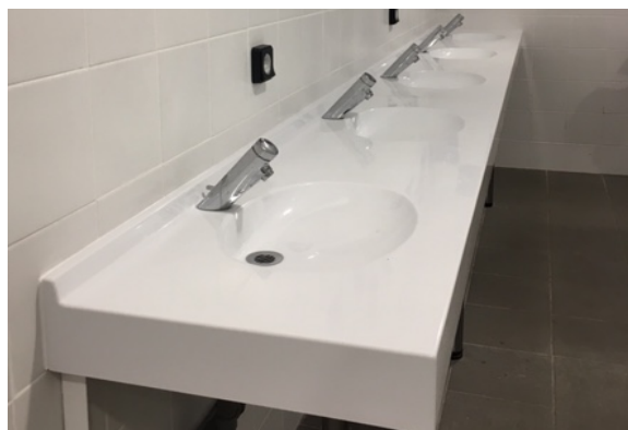
Version Marbol Blanc, sans trop-plein

Le dossier arrière de 30 mm, les vasques, le plan de profondeur 500 ou 550 mm et le bandeau frontal sont moulés monobloc sans joint. Ce modèle répond à la norme pour les Personnes à Mobilité Réduite.