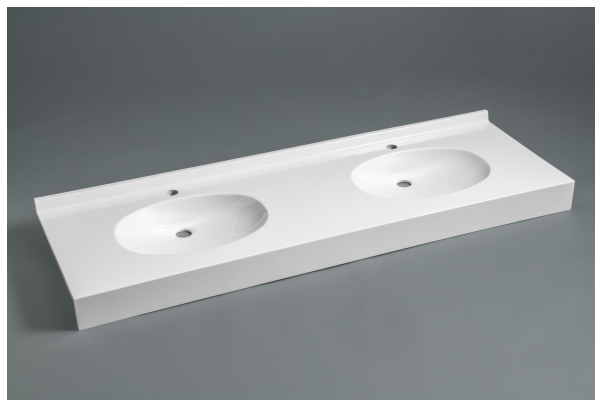
Version Marbol Blanc, sans trop-plein

Le dossier arrière de 30 mm, les vasques, le plan de profondeur 500 mm et le bandeau frontal sont moulés monobloc sans joint. Ce modèle répond à la norme pour les Personnes à Mobilité Réduite.