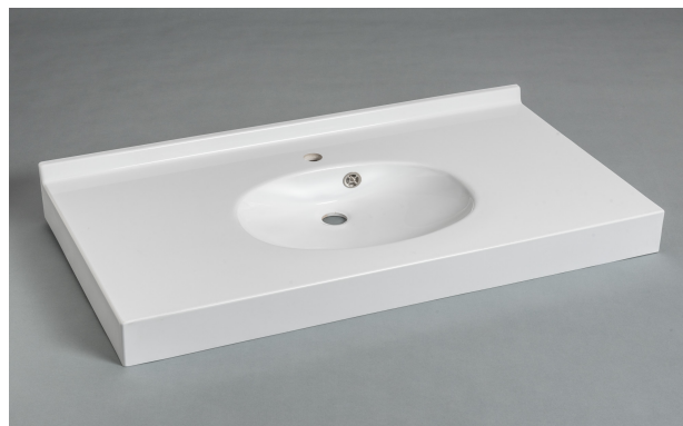
Version Marbol Blanc, joue latérale, avec trop-plein

Le dossier arrière de 30 mm, la vasque, le plan de profondeur 500 mm et le bandeau frontal sont moulés monobloc sans joint. Ce modèle répond à la norme pour les Personnes à Mobilité Réduite.