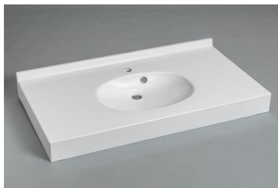
Version Marbol, joue latérale, trop plein

Le dossier arrière, la vasque, le plan de profondeur 490 mm et le bandeau frontal sont moulés monobloc sans joint. Ce modèle répond à la norme pour les Personnes à Mobilité Réduite.